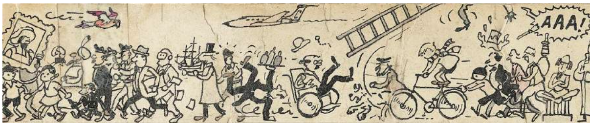
Fragment van de originele tekening (in 2 delen) met inkt en in kleur op papier dat op karton werd gekleefd, 85 X « ,5 cm et 95 X 3,5 cm.

L'Usine à Bulles opent haar deuren tijdens het weekend van 25 en 26 november 2017 in het Théâtre de Liège met de ambitie om erfgoed en moderniteit te combineren. De bezoekers van het Festival hebben namelijk het privilege om de voorbereidende tekeningen te ontdekken die Hergé juist voor zijn overlijden heeft gerealiseerd voor het fresco van het station Stockel in Brussel. Maar onder leiding van haar nieuwe voorzitter, Stéphan Uhoda, en haar stichter, Fabrizio Borrini, heeft het team ook een tweede editie voorbereid die zeer gedurfd is, nog meer gericht op nieuwe experimenten en nieuwe technologieën dan voordien. Het Festival wil eveneens het plezier stimuleren om verenigd te zijn rond dezelfde passie, stripverhalen maar ook veel meer.... Strips worden namelijk gecombineerd met andere artistieke disciplines die gebaseerd zijn op visuele storytelling. Een unieke manier om strips van gisteren, vandaag en morgen te belichten aan de hand van een eclectische en internationale programmatie met performances, workshops, tentoonstellingen, ontmoetingen, opvoeringen, installaties van hedendaagse kunst en signersessies.