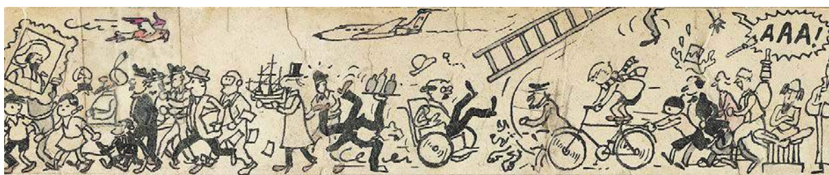
Extrait du dessin original (en 2 parties) à l'encre avec rehauts de couleurs sur papier contrecollé sur carton, 85 X « ,5 cm et 95 X 3,5 cm.

L'Usine à Bulles ouvrira ses portes le week-end des 25 et 26 novembre 2017 au Théâtre de Liège avec l'ambition de marier patrimoine et modernité. Les visiteurs du Festival auront en effet le privilège de voir les dessins préparatoires réalisés par Hergé juste avant son décès pour la réalisation de la fresque murale de la station Stockel à Bruxelles. Mais sous la houlette de son nouveau Président, Stéphan Uhoda, et de son initiateur, Fabrizio Borrini, l'équipe a aussi préparé une deuxième édition résolument audacieuse, l'oreille plus que jamais tendue vers les nouvelles expérimentations et les nouvelles technologies. Le Festival promet également de privilégier le plaisir d'être réunis autour d'une même passion, la bande dessinée mais pas que... Il la confrontera, en effet, à d'autres disciplines artistiques basées sur la narration visuelle. Une façon unique de mettre en lumière la BD d'hier, d'aujourd'hui et de demain à travers une programmation éclectique et internationale de performances, ateliers, expositions, rencontres, spectacles, installations d'art contemporain et dédicaces.