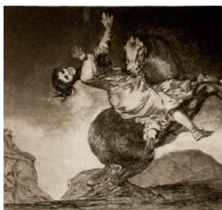
El caballo raptor 1815/19 eau-forte/aquatinte (Los Disparates).