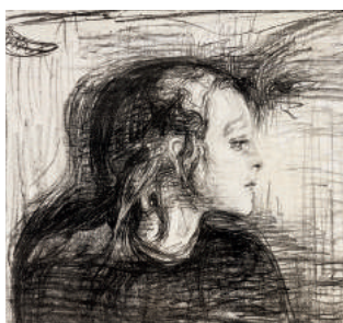
Sick Child 1896 litho