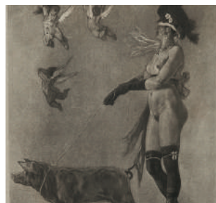
Pornocratès 1878 eau-forte