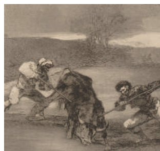
Otro modo de cazar a pie 1814/16 eau-forte/aquatinte (La Tauromaquia)