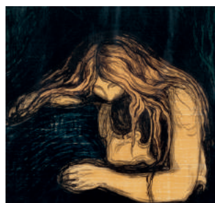
Vampire II 1895/1902 litho & gravure sur bois