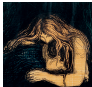
Vampire II 1895/1902 litho & gravure sur bois