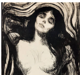
Madonna 1895/1902 litho