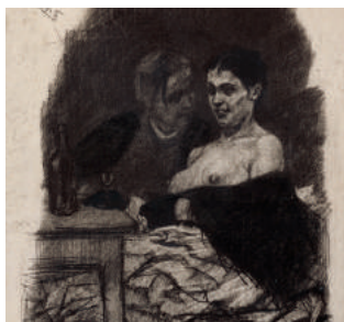
Le quatrième verre de cognac ca 1880, héliogravure