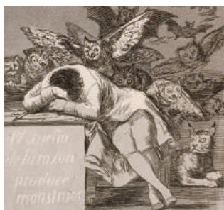
El sueño de la razón produce monstruos 1799 eau-forte/aquatinte (Los Caprichos).