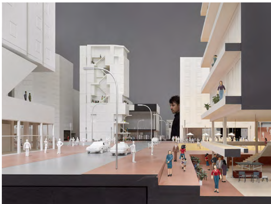
Model of a collective city, 2017