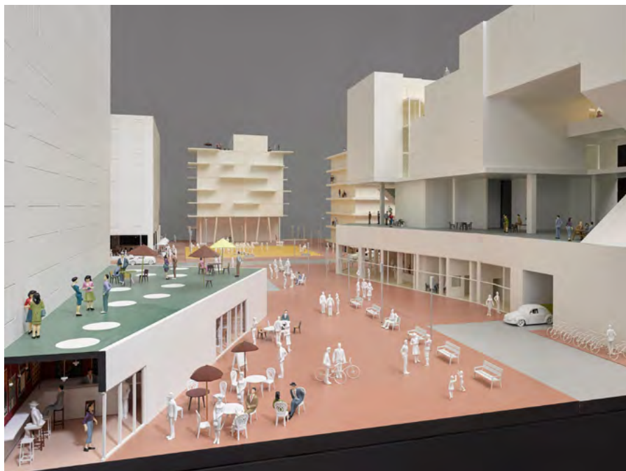
Model of a collective city, 2017